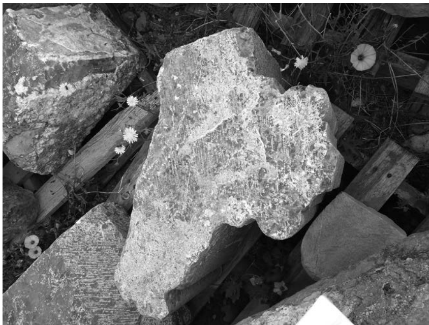
Figura 6. Una de les dovelles per abrancal de porta gòtica provinent d'un dels murs del convent de Sant Francesc. Museu Arqueològic de Sagunt.

convent identificades amb l'antic ajuntament. 33 Aquestes dovelles formarien part, tal com apunten Hernández, E. i Sánchez, P., de la porta que s'obria cap a l'exterior, direcció Est del recinte (que feia 3m de llum). 34