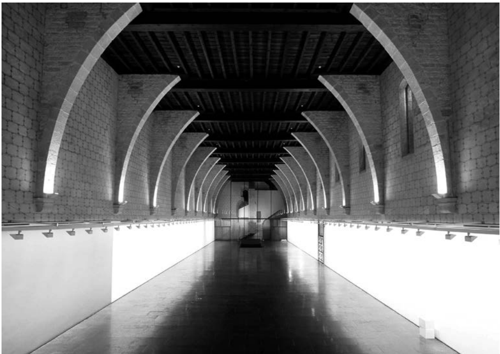
Figura 11. Dormidor del Monestir de clarisses de Pedralbes de Barcelona.