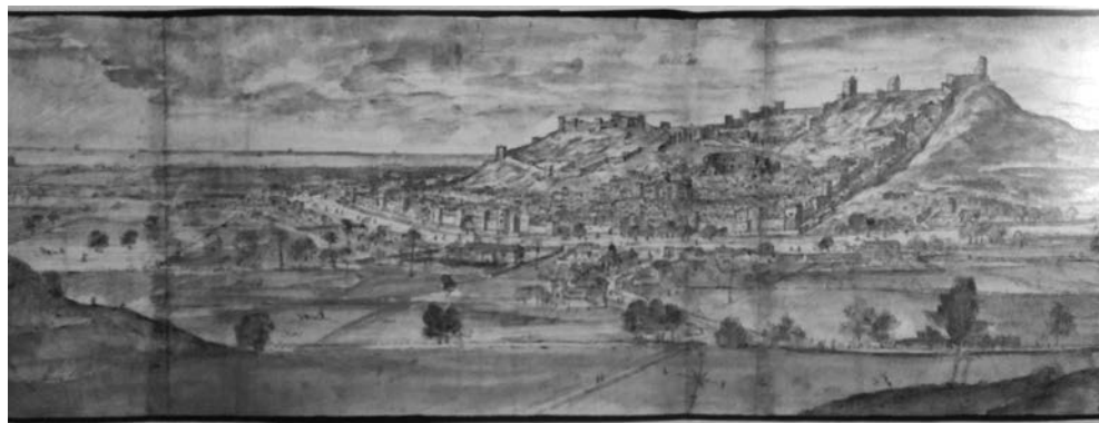
Figura 1. Vista de Morvedre. Anthonie van den Wijngaerde (1563).

Un altre dels ordres mendicants que més presència va tindre a la Corona d'Aragó van ser els dominics, tot i que a Morvedre el seu establiment no es va materialitzar definitivament. Tanmateix, en resulta estranya l'absència si tenim en compte que, a part de crear Estudis Generals, els predicadors també es dedicaren a fomentar l'estudi de l'hebreu i l'àrab, llengües que es parlaven a la vila. 10