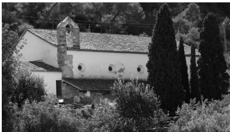
Figura 3. Església de Sant Feliu, Xàtiva. Ajuntament de Xàtiva.

L'església la podríem relacionar amb la d'El Salvador de Morvedre o amb la de Sant Feliu de Xàtiva, que segueixen el model d'esglésies d'arc diafragma. Aquesta tipologia, estava plenament assentada en el segle XIII i era una solució molt viable, perquè no requeria una gran quantitat de pedra. Tot i que la construcció en arcs diafragmàtics estava lligada a un origen cistercenc, tingué gran acceptació per part de les congregacions mendicants, tal vegada perquè continuava infonent l'ideal de pobresa que representaven els antics convents de l'orde del Cister.