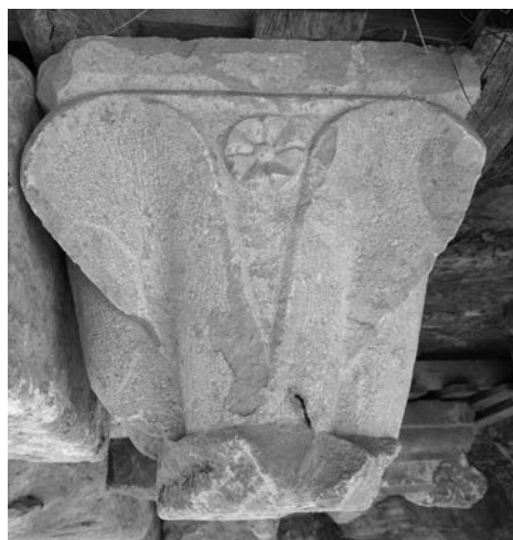
Figura 9. Capítell de fulles carnosos de columna quadri lobulada. Museu Arqueològic de Sagunt.

mentar una de les portes d'entrada al recinte de talla i motlures gòtiques, peces del claustre i altres parts del convent datades al voltant dels segles XIV i XV.