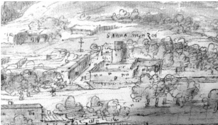
Figura 4. Detall del convent de Santa Anna a les Vistes de Morvedre d'Anthonie van den Wijngaerde.

A més dels edificis conventuals, a Morvedre també s'establí un beateri de dones al barri de sant Domènec (Santa Anna). Segons Chabret: " En el año 1348 algunas mujeres piadosas fundaron un beaterio en una casa que existía extramuros de la villa de Murviostro, donde hoy se levanta el convento de monjas de Santa Ana. " 17 Els beateris, fora de la tutela eclesiàstica, eren cases de dones (tot i que també existien d'homes) que practicaven una vida religiosa de manera autònoma i sense seguir cap vot o regla monacal. Freqüentment, eren sostingudes per amplis sectors de la noblesa i comptaven amb l'ajuda d'un sacerdot secular o un frare mendicant que dirigia la seua vida espiritual. Atesa la importància que anaven adquirint, l'Església va voler limitar-ne la influència, i les van obligar a adoptar una regla monàstica o que s'adscrigueren a un orde monàstic preexistent, per tant, apuntem la possibilitat que algunes d'aquestes laiques morvedrines adoptaren finalment la regla de sant Agustí, a finals del segle XV, i es convertiren en monges servites. 18