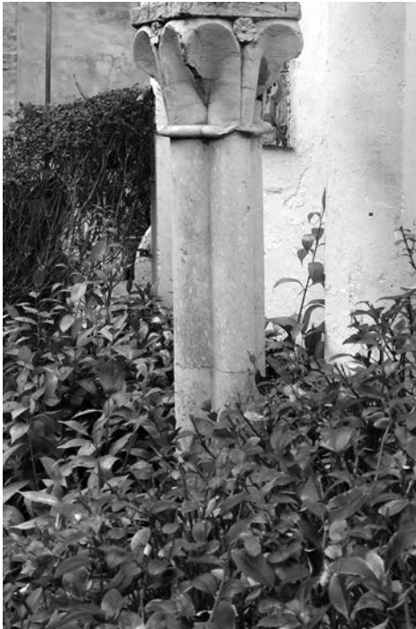
Figura 10. Capitell de fulla carnosa i fust de columna quadrilobulada. Museu Benlliure de València. Ajuntament de València.

Tots aquests elements constructius denoten l'elevat pressupost de què disposava, sobretot després de saber que la Corona i el govern de la vila van atorgar l'ajuda necessària per a fer remodelacions així com pel gran nombre de picapedrers que treballaren a les obres i que és apreciable pels copiosos símbols que marcaren als seus murs. Marques que es poden observar també a la Catedral de València, a Santa Maria de Morvedre, a Santa Maria d'Alacant i a la Llotja de Mallorca. Una disparitat de llocs gens estranya, ja que, normalment, les colles de picapedrers eren itinerants, així que ben bé un dia podien desenvolupar la seua tasca a València, un altre a Alacant o treballar simultàniament en diferents edificis dins la mateixa localitat, com ocorre a Morvedre, on apareixen idèntiques marques tant a l'església de Santa Maria com al dit convent franciscà. Els picapedrers portaven les formes, models i estils per allà on se'ls contractava.