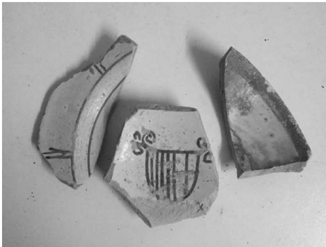
Figura 12. Plat o escudella, localitzada a les excavacions de 2005, Caixa 6, Material ceràmic, 02. Museu Arqueològic de Sagunt.

Quant a peces de caràcter artístic, el convent, com qualsevol entorn d'aquest tipus, posseïa relíquies amb els seus corresponents reliquiaris, objectes per a la litúrgia, la roba per a celebrar els oficis, així com escultures i pintures que decorarien les capelles i oratoris. Entre aquestes, cal destacar el Crist crucificat del segle XV, que va ser restaurat i que actualment es pot contemplar a un dels altars de l'ermita de la Sang, també a Morvedre. Però, sobretot, cal fer notar aquelles peces que pel seu caràcter quotidià, de vegades passen més desapercebudes. Ens referim a la ceràmica de taula, i per tant d'ús domèstic. 42