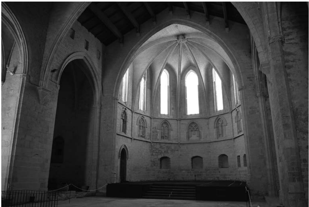
Figura 7. Interior de l'església del convent de Sant Francesc de Morella. Vista del presbiteri. Ajuntament de Morella.

La fàbrica del convent de Morvedre també era de pedra, amb un claustre de robustes columnes gòtiques, segons s'ha pogut comprovar arran de les últimes excavacions realitzades en la plaça de la Glorieta en 2005. També es va docu-