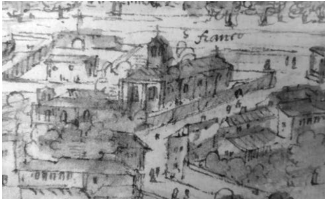
Figura 5. Detall del convent de Sant Francesc de les Vistes de Morvedre d'Anthonie van den Wijngaerde.

De nou, en les vistes de Wijngaerde es pot apreciar com la ciutat s'havia expandit a fora dels seus murs i al voltant del convent. Per tant, és molt probable que les muralles que es veuen tancant les cases que hi ha extramurs, així com les que s'observen al convent, foren el resultat d'aquesta ampliació. La carta ens desvela també un altre fet important, i és que, a finals del segle XIV, tot i que va ser una dura centúria a causa de la guerra i la pesta, la població va augmentar a la vila de Morvedre, i això, possibilità invertir per embellir el convent.