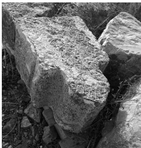
Figura 8. Nervi de volta. Museu Arqueològic de Sagunt.